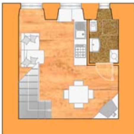
Piano terra seminterrato